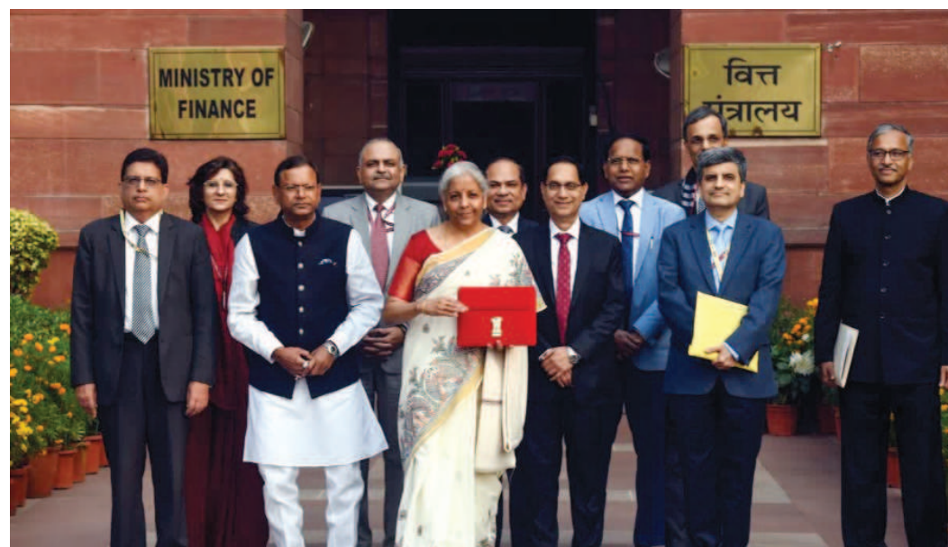
తలెత్తాయి. ఈ సవాళ్లన్నింటినీ ఎదుర్కొని ఆమె భారత ఆర్థిక వ్యవస్థను ముందుకు నడిపించారు. ఆమె హయాంలోనే భారత్ ప్రపంచంలోనే వేగంగా అభివృద్ధి చెందుతున్న ప్రధాన ఆర్థిక వ్యవస్థగా అవతరించింది.

నిర్మలా సీతారామన్ మరో అరుదైన రికార్డును కూడా సొంతం చేసుకున్నారు. ఆమె 2019 మే 31న ఆర్థిక మంత్రిగా బాధ్యతలు స్వీకరించారు. 2026 జనవరి 31 నాటికి ఆమె ఈ పదవిలో 6 ఏళ్ల 8 నెలలు పూర్తి చేసుకున్నారు. గతంలో సి.డి. దేశ్ ముఖే సుమారు 6 ఏళ్ల 2 నెలల పాటు నిరంతరాయంగా ఆర్థిక మంత్రిగా పనిచేశారు. ఇప్పుడు నిర్మలా ఆ రికార్డును బద్దలు కొట్టి, అత్యధిక కాలం పరుసగా ఆర్థిక మంత్రిగా పనిచేసిన వ్యక్తిగా నిలిచారు. మన్మోహన్ సింగ్ 5 ఏళ్ల, అరుణ్ జైట్లీ 4 ఏళ్ల 8 నెలలు, యశ్వంత్ సిన్హా 4 ఏళ్ల 2 నెలలు ఈ పదవిలో ఉన్నారు. నిర్మలా సీతారామన్ బాధ్యతలు చేపట్టిన సమయంలో ప్రపంచాన్ని కొవిడ్-19 కుదిపేసింది. ఆ తర్వాత భౌగోళిక రాజకీయ ఉద్రిక్తతలు