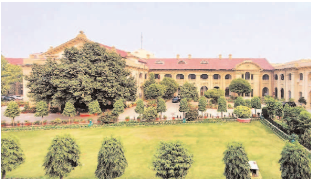
దొంగతనం లాంటి చిన్నపాటి నేరాల్లో కూడా పోలీసులు నిందితుల బెయిల్ పిటిషన్లను విచారించే సందర్భంలో ఈ విచక్షణారహితంగా కాల్పులు జరుపుతూ, వాటిని ఎన్కౌంటర్లుగా సృష్టిస్తున్నారని న్యాయమూర్తి ఆందోళన వ్యక్తం చేశారు. వివిధ ఎన్కౌంటర్లలో గాయపడిన ముగ్గురు